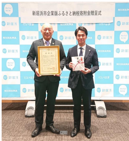
右) 新居浜市 古川市長

■参考 URL: https://www.city.niihama.lg.jp/soshiki/seisaku/kigyoubanh2or7.html